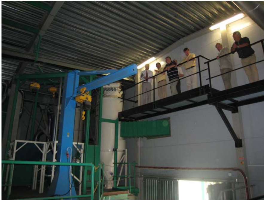
Toppvy från demonstrationsrampen.