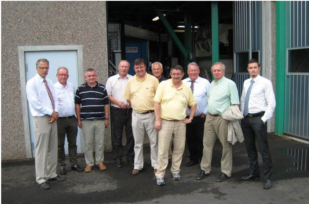
Hela gruppen utanför BIOAGRO-anläggningen.