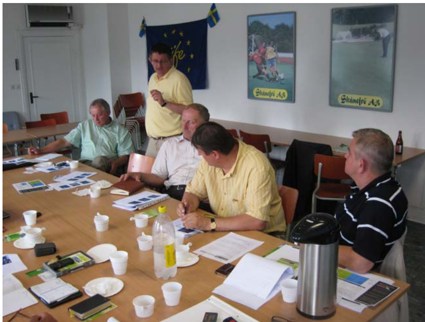
Den polska delegationen.