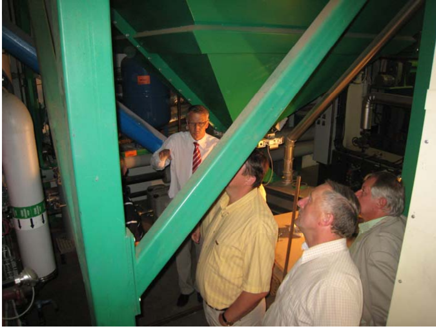
Demonstration av pelletsflödet.